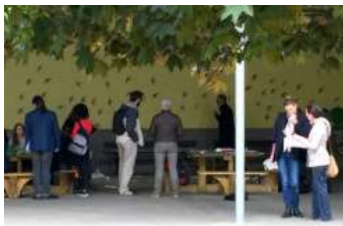
Réalisation d'une fresque sous le préau.